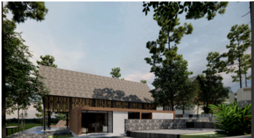
Perspektif Area Lobby