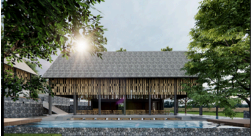
Perspektif Area Cafe & Resto