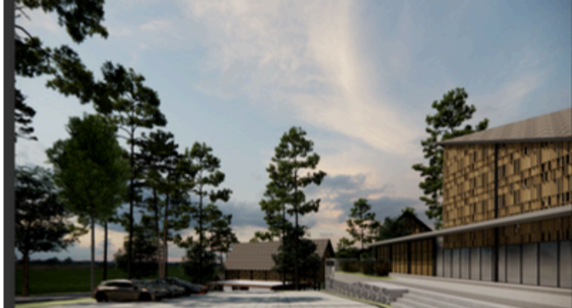
Perspektif Area Parkir