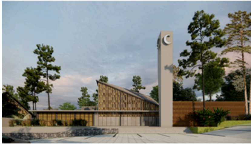
Impresi visual Masjid