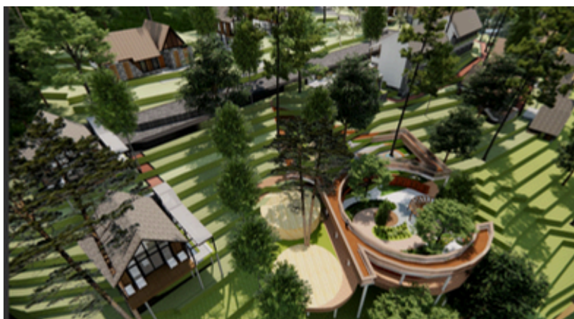
Aerial View Area Healing/ Gardu Pandang