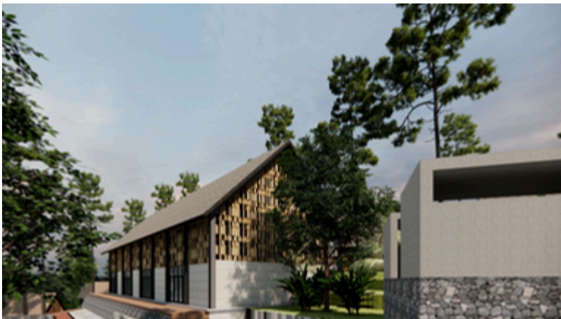
Perspektif Area Aula