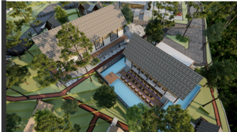
Aerial View Cafe & Aula