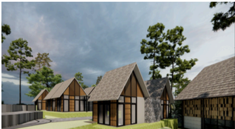
Perspektif Area Hunian Tahfidz