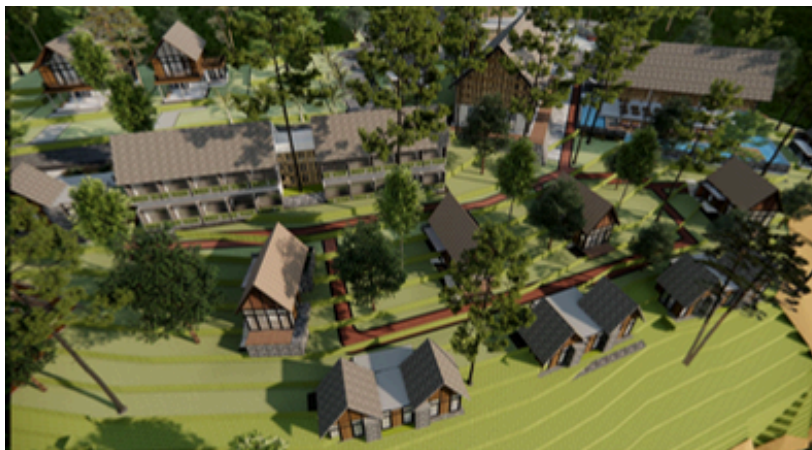
Aerial View Rent Room & Cottage