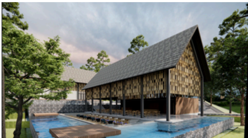
Perspektif Area Cafe & Resto