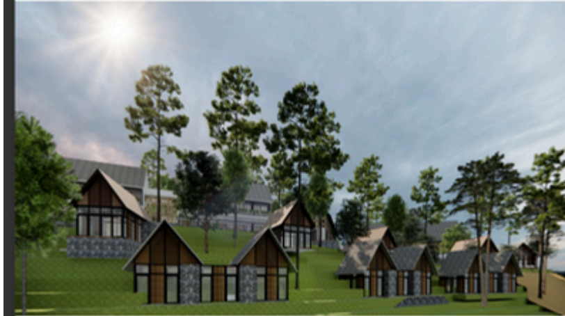
Perspektif Area Cottage